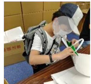
ショッピングバックのタック付け