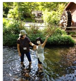
川遊びもできる 夕やけ小やけ ふれあいの里