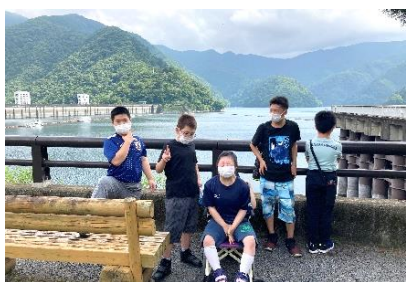
緑に囲まれ一面に広がる 奥多摩湖