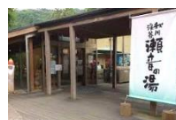
足湯を楽しんだ 秋川の瀬音の湯