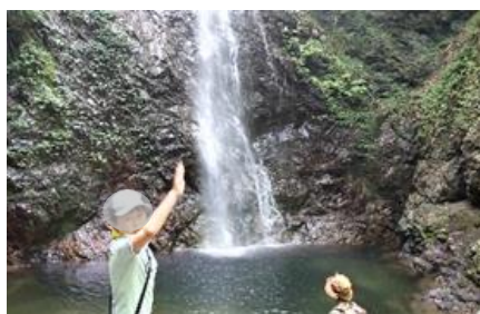
滝山町より6度も低く涼しかった 桧原村 払沢の滝